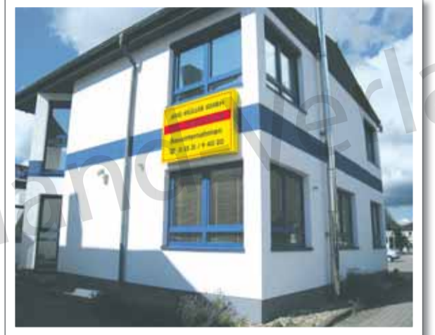
Das Bauunternehmen hat seinen Firmensitz im Holzmindener Burgbergblick 8.

Um sich bei ihren Mitarbeitern, deren Familien, Kunden, Lieferanten und weiteren Geschäftspartnern für die gute und fruchtbare Zusammenarbeit zu bedanken, wurde das zehnjährige Jubiläum jetzt gemeinsam auf dem eigenen Betriebsgelände gefeiert.